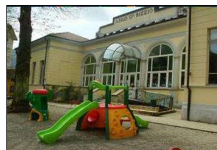
INFANZIA di VALDUGGIA