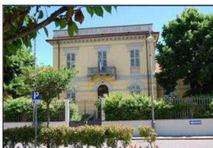
INFANZIA di SERRAVALLE