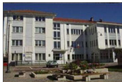
SECONDARIA 1° GRADO di SERRAVALLE