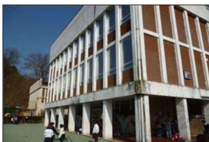
PRIMARIA di VALDUGGIA