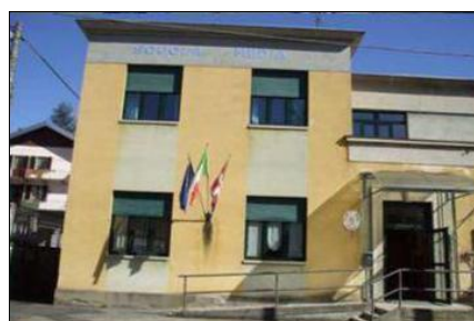
SECONDARIA 1° GRADO di VALDUGGIA