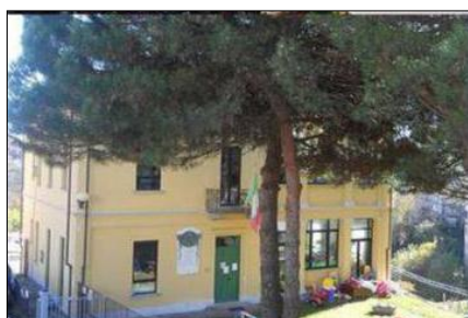
INFANZIA e PRIMARIA di CELLIO