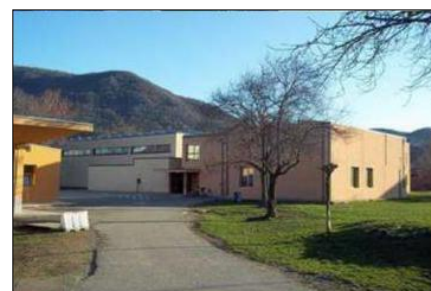
PRIMARIA di SERRAVALLE