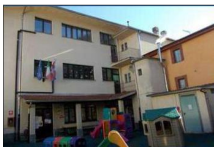
INFANZIA di BORNATE

L'Istituto Comprensivo "Padre Redento Baranzano" di Serravalle Sesia, che gravita su tre Comuni della Provincia di Vercelli: Serravalle Sesia, Valduggia e Cellio, comprende tre scuole primarie, quattro scuole dell'infanzia e due scuole secondarie di primo grado.